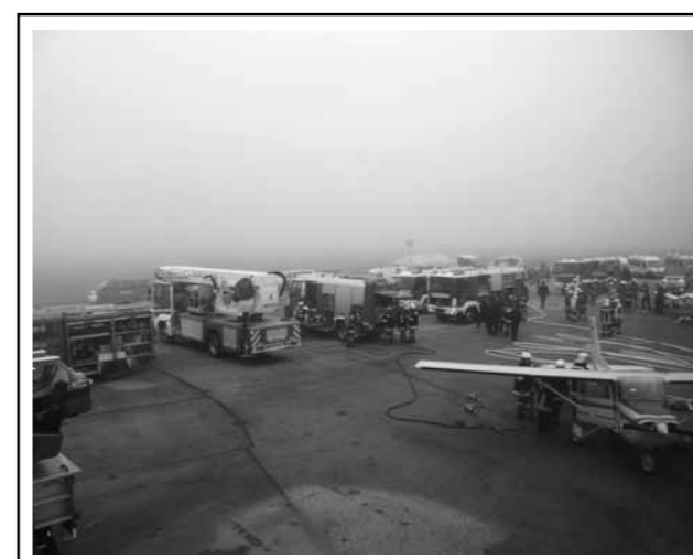
Großschadensübung Flughafen Gneixendorf November 2012: Eine interessante Übung auf dem Flughafen.

KUGELLAGER · HYDRAULIK MOTORGERÄTE · FACHWERKSTÄTTE