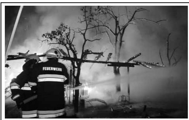
26. September 2012: Schuppenbrand (Gedersdorf)