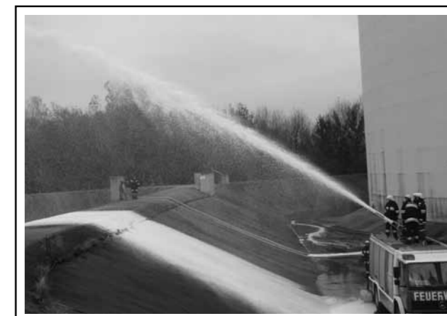
UA-FOBI „Thema Löschschaum“ / Oktober 2012