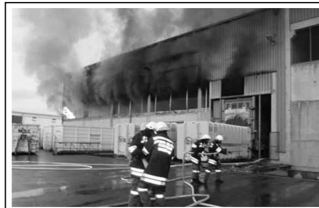
21. Juli 2012: Brand bei der Firma Brantner (Gewerbepark Krems)