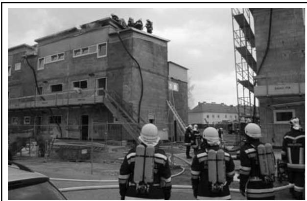
29. März 2012: Brand einer Baustelle (Mittergriesweg / Lerchenfeld)