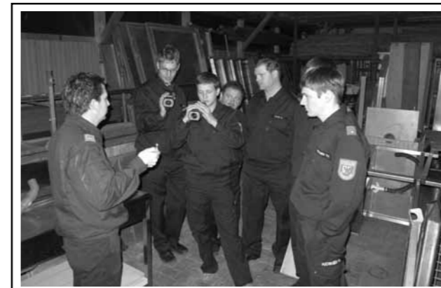
Einschulung auf die Wärmebildkamera / Februar 2012: Neue Geräte müssen erprobt werden.