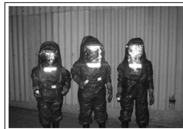
Atemschutz- und Schutzanzugübung / September 2012: Sich einmal wie Felix Baumgartner fühlen.