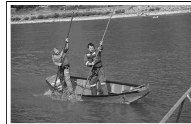
Wasserdienstausbildung / Mai 2012: Wasser – ein stets herausforderndes Element